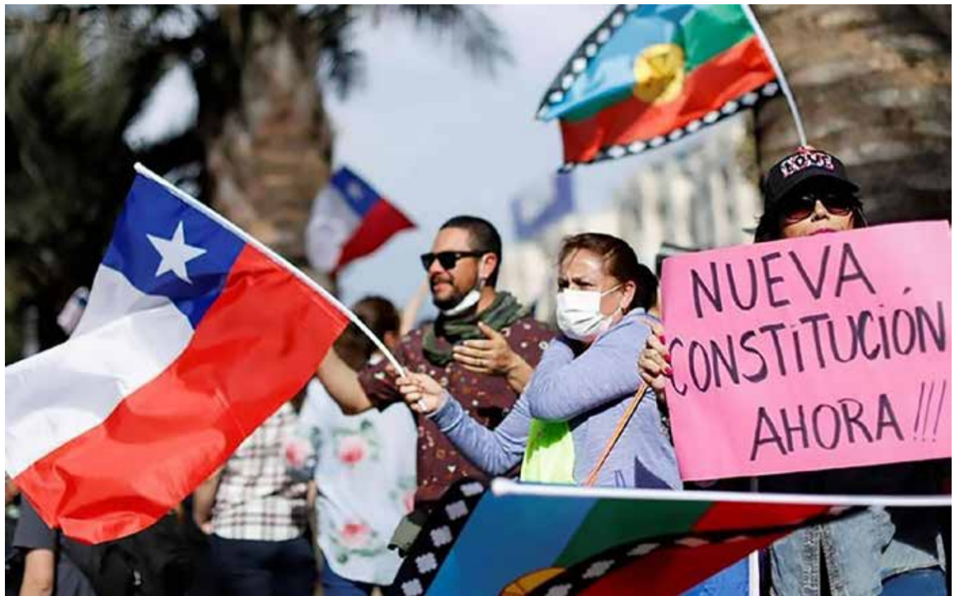
Chileans demonstrate in favour of a new Constitution.

tuted attacks on press freedom and freedom of expression. On the other hand, these new regulations emerged in highly politicized environments and were often seen as tools for the governments of the day to promote their political agendas, making them vulnerable to being weakened or dismantled as new governments came into power.